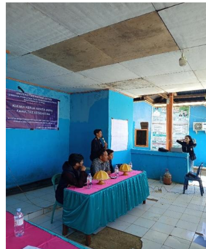
Gambar 1. Pelaksanaan kegiatan Pengabdian Ekoenzim

Tabel 1 menunjukkan bahwa seluruh aspek mengalami peningkatan nilai yang signifikan setelah pelaksanaan kegiatan. Peningkatan tertinggi terdapat pada aspek proses pembuatan ekoenzim, yang mengindikasikan keberhasilan metode demonstrasi dan praktik langsung.