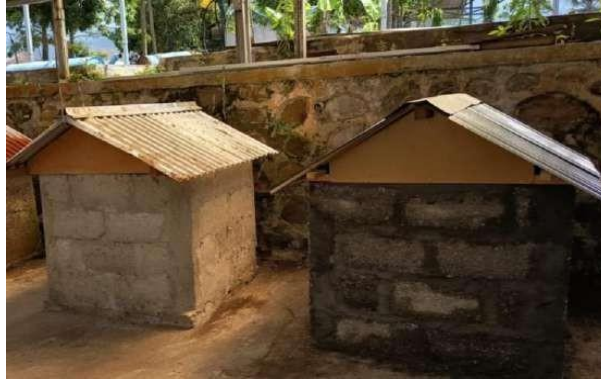
Gambar 1. Desain Miniatur Bangunan