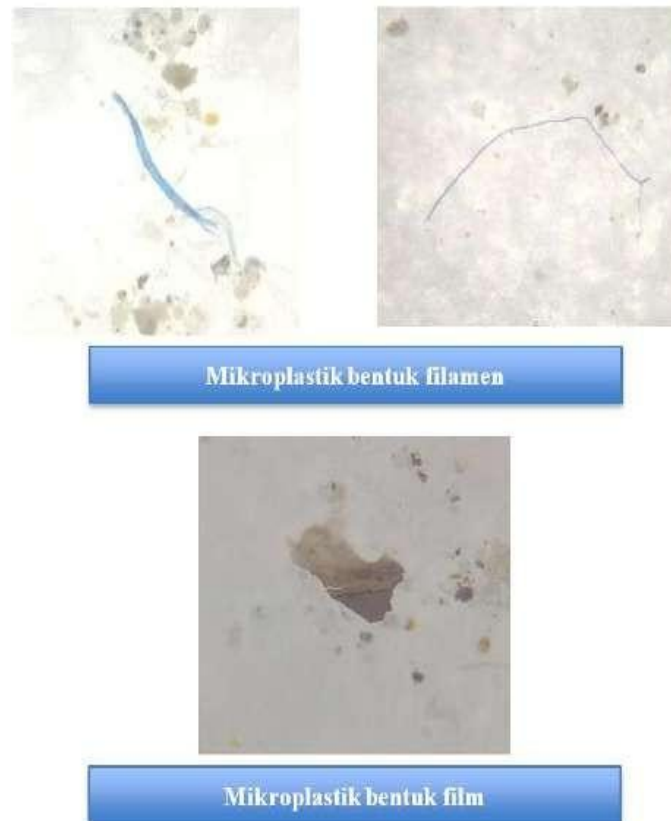
Gambar 3. Dokumentasi Mikroplastik yang Teridentifikasi pada Sampel Udara