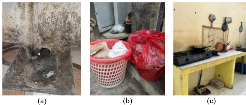
(a) (b) (c)

Tabel 2 menunjukkan bahwa terdapat hubungan antara higiene rumah tangga dengan kepadatan tikus. Hasil uji Chi Square pada variabel lubang/celah rumah memperoleh nilai p-value 0,003, tempat sampah tertutup 0,008, dan kondisi dapur 0,009. Seluruh nilai p-value <0,05, sehingga dapat disimpulkan bahwa lubang/celah rumah, tempat sampah tertutup, dan kondisi dapur memiliki hubungan yang signifikan dengan kepadatan tikus. Rumah dengan higiene rumah tangga yang tidak sesuai cenderung memiliki kepadatan tikus yang lebih tinggi dibandingkan rumah dengan higiene rumah tangga yang baik. Berdasarkan observasi di lapangan, kondisi higiene rumah tangga tampak seperti Gambar 2.